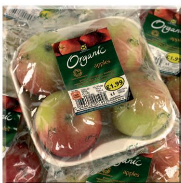
Imagen 1 Ejemplo de producto orgánico con envoltura continua de NatureFlex™ NVS.

La etiqueta «No Need to Remove» es una etiqueta Biotak™ de Berkshire Labels, Reino Unido. Biotak™ es un material laminado autoadhesivo, totalmente biodegradable y apto para el compostaje que incorpora un adhesivo también biodegradable y la película frontal biodegradable NatureFlex™ NVL creada por Innovia Films.